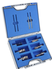
Sada jádrových vrtáků SILVER-LINE 25 + vrták BLUE-LINE

Objednací číslo 3873008 Cena bez DPH 3 490 Kč Cena s DPH 4 223 Kč