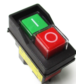
Hlavní vypínač pro magnetické vrtačky MB 351, MB 351 F, MB 502 E, KE 16-2

Objednací číslo 0386035149 Cena bez DPH 260 Kč Cena s DPH 315 Kč