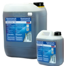
Karnasdi PROFESSIONAL TOOLS

Objednávací číslo 1011 Cena bez DPH 1 099 Kč Cena s DPH 1 330 Kč