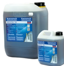
Karnasdi PROFESSIONAL TOOLS

Objednávací číslo 38760.1100025 Cena bez DPH 899 Kč Cena s DPH 1 088 Kč