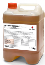
Chladicí kapalina AG FRIGUO 2000 HFX, koncentrát, 5 kg

Objednávací číslo 1011 Cena bez DPH 1 099 Kč Cena s DPH 1 330 Kč