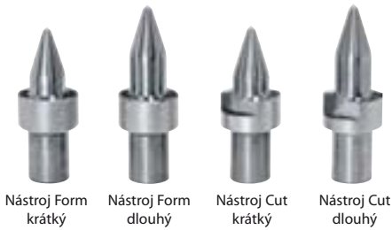
Nástroj Form krátký Nástroj Form dlouhý Nástroj Cut krátký Nástroj Cut dlouhý

Nástroje Thermdrill jsou nabízeny ve všech standardních velikostech M3 – M20 (metrické), 1/8" – 1/2", dále pro přesné otvory v rozměrech 2 – 30 mm s odstupňováním po 0,1 mm. Pokud není možné použít standardní velikosti, nabízíme „nástroje šité na míru“, které budou vyrobeny podle požadavků zákazníka.